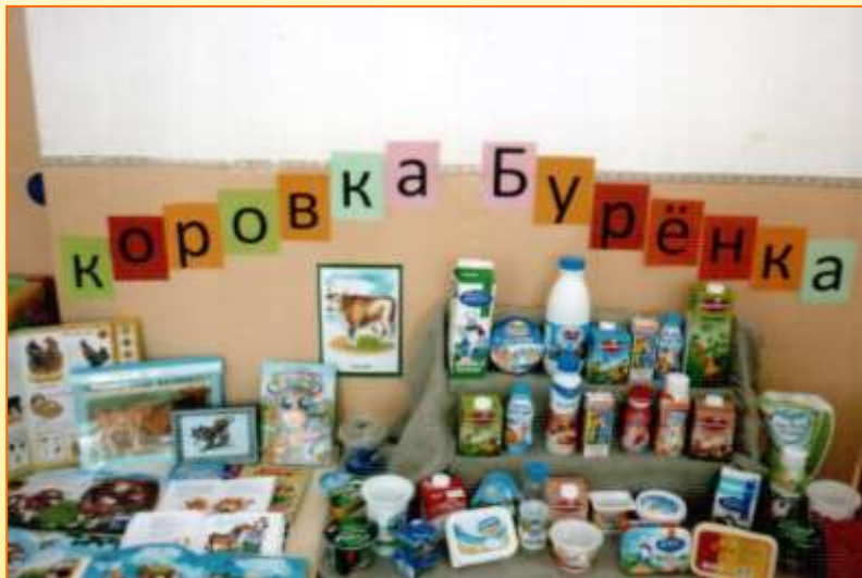
Мини – музей «Коровка Бурёнка»